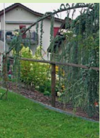
Böschungen mit Gefälle