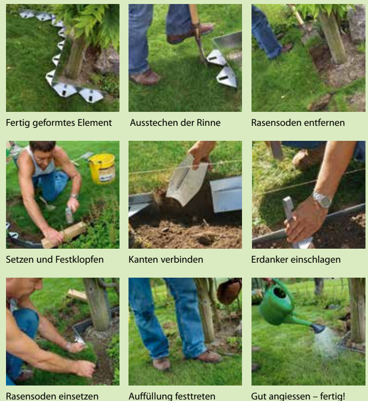
Fertig geformtes Element Ausstechen der Rinne Rasensoden entfernen Setzen und Festklopfen Kanten verbinden Erdanker einschlagen Rasensoden einsetzen Auffüllung festtreten Gut angießen – fertig!

Das Schönste an diesem System ist die Tatsache, dass das Verlegen in den Boden wirklich einfach und schnell von sich geht. Ohne tiefen Grabenaushub oder Fundamente werden Wege und Rabatten vom Rasen getrennt. Entlang einer Richtschnur oder vorge-