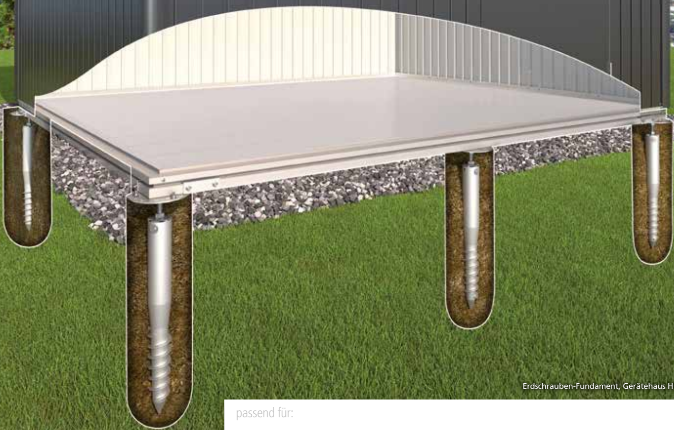
Erdschrauben-Fundament, Gerätehaus HighLine Grösse H2