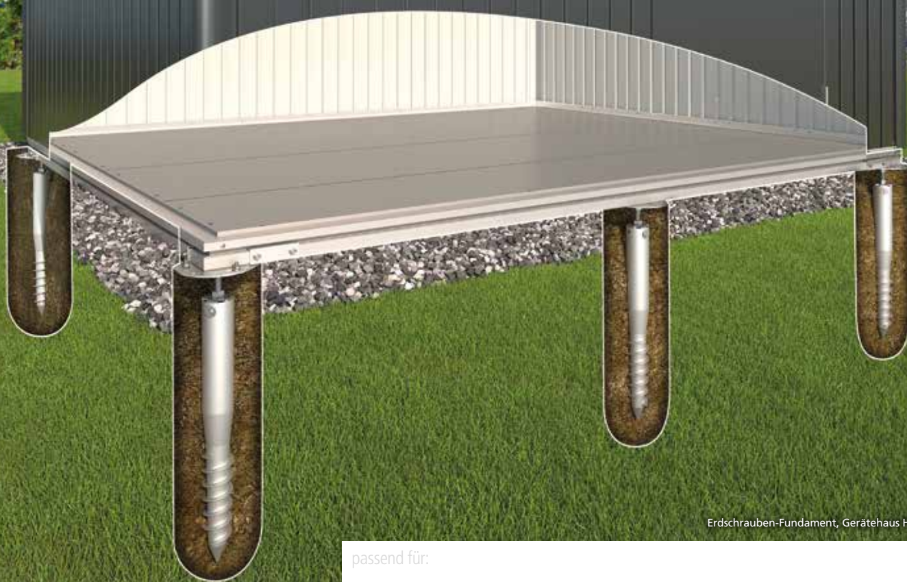
Erdschrauben-Fundament, Gerätehaus HighLine Größe H2